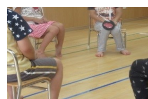
フルーツバスケット