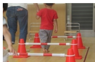
行動トレーニング

児童福祉法及びその関連法令で定められている金額 受給者証に記載された上限金額 施設外活動にかかる 交通費・食事代・教材費・入場料等